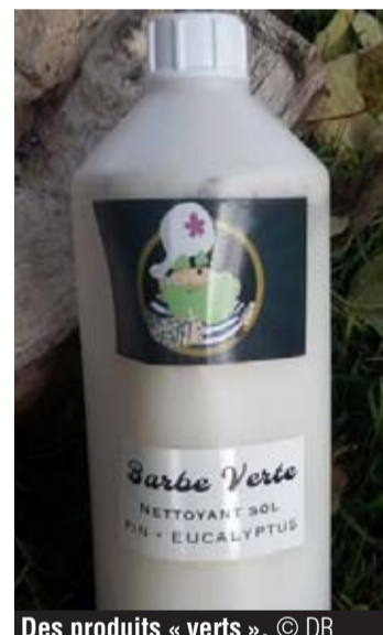
Des produits « verts ».

Quant aux emballages utilisés par le couple, ils sont le plus écologiques possible. « On utilise du polyéthylène à haute densité. C'est le plastique le moins toxique et le plus durable qu'on puisse trouver sur le marché. Lorsqu'on met quelque chose de chaud dans les récipients, il n'y a pas de risque de transfert entre le contenu et le contenant. »