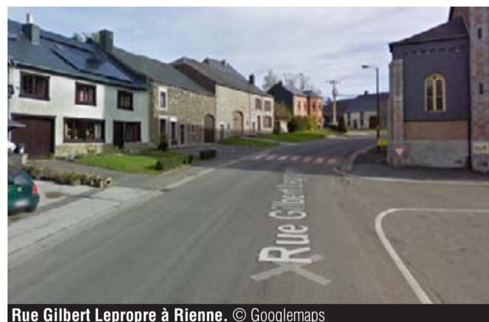
Rue Gilbert Leprope à Rienne.